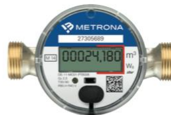
Contatore elettronico Typ 8 star a radiotrasmissione

I contatori elettronici soprintonaco per la misura dei consumi d'acqua calda e fredda sono del tipo a secco ed a getto singolo. La vasta gamma di prodotti con diverse dimensioni e portate garantisce l'impiego di questi contatori nelle più disparate situazioni impiantistiche. Il rilievo elettronico dei giri della turbina permette un'elevata precisione ed affidabilità. Nella versione con sistema di radiotrasmissione integrato i dati di consumo e di funzionamento vengono inviati via radio rendendo superfluo l'ingresso negli appartamenti.